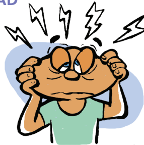
DOLORES DE CABEZA