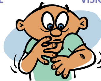
HERIDAS QUE TARDAN EN SANAR

UN NIVEL ALTO DE GLUCOSA EN LA SANGRE PUEDE CAUSAR UNA EMERGENCIA MÉDICA SI NO SE TRATA