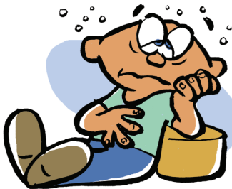
DEBILIDAD O CANSANCIO