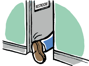
NECESIDAD DE ORINAR CON FRECUENCIA